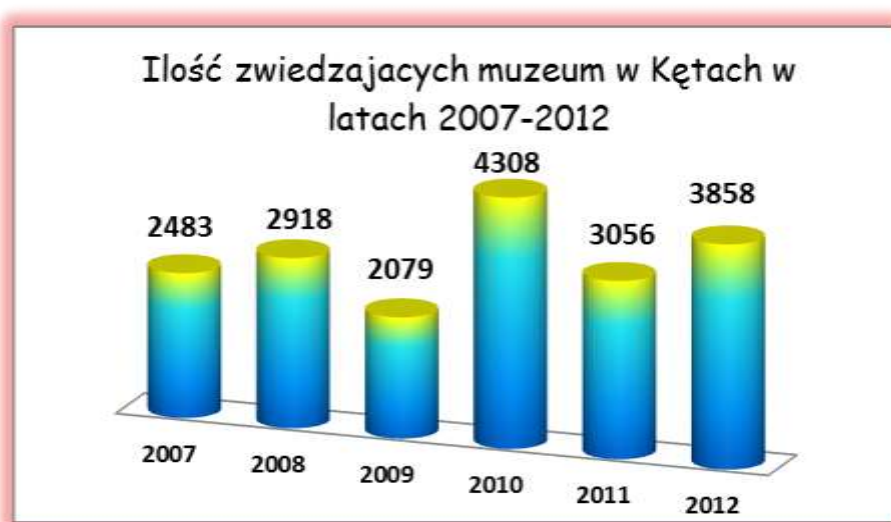
Tab. 1. Ilość sprzedanych biletów Muzeum im. A. Kłosińskiego w Kętach w latach 2007-2012.

Wykres. 1. Ilość odwiedzających Muzeum im. A. Kłosińskiego w Kętach w latach 2007-2011.